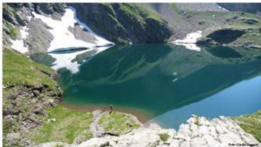
Lago di Varro (m 2236)